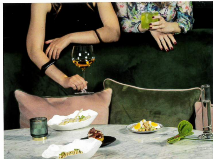
FLORENZ – Besuch in der vibrierenden Gourmet-Metropole