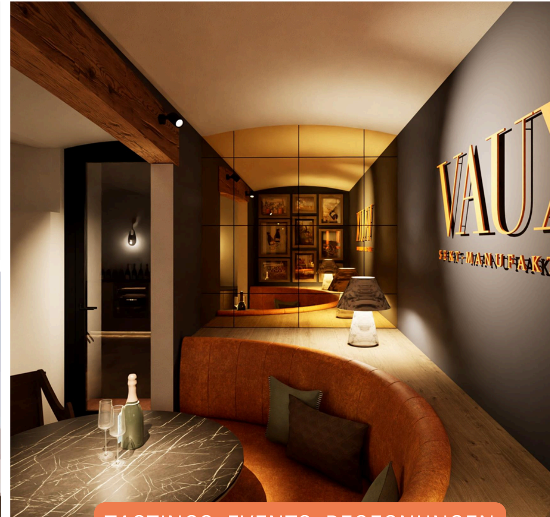
TASTINGS, EVENTS, BEGEGNUNGEN